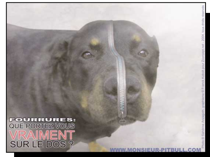
FOURRURES: QUE PORTEZ VOUS VRAIMENT SUR LE DOS ?

Mr Y, lui, n'achète quasiment que du chat, car les fourrures de chiens sont souvent de bien trop mauvaise qualité, d'après lui. Ses clients sont de très célèbres couturiers et ils demandent, bien entendu, le « meilleur »... Il montrera à notre instigatrice, un manteau fait de centaines de chevrons, soit d'une infime partie du corps de centaines de chats, sensée être la plus noble et douce, qui sont ensuite assemblés avec une infinie précision. Le travail semblerait tout aussi admirable s'il avait été réalisé en fourrures acryliques, ces nouvelles matières peu coûteuses, impressionnantes de réalisme et de douceur. Mais il n'en est évidemment pas question, dans cette course au « vrai » et au luxe, même si celui-ci est teinté de sang. Peu importe, la quasi-totalité des fourrures est de toutes manières reinteinte avant exportation, afin de ne pas éveiller les soupçons. En effet, depuis un an, l'existence d'un