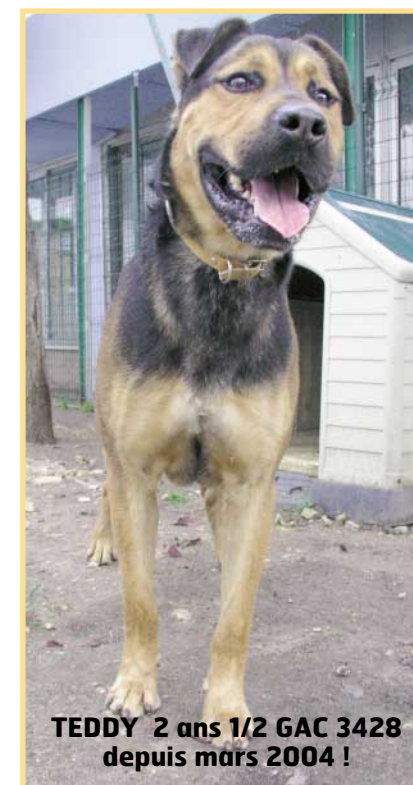
TEDDY 2 ans 1/2 GAC 3428 depuis mars 2004 !