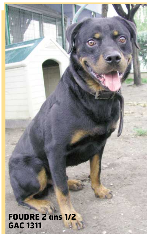
FOUDRE 2 ans 1/2 GAC 1311